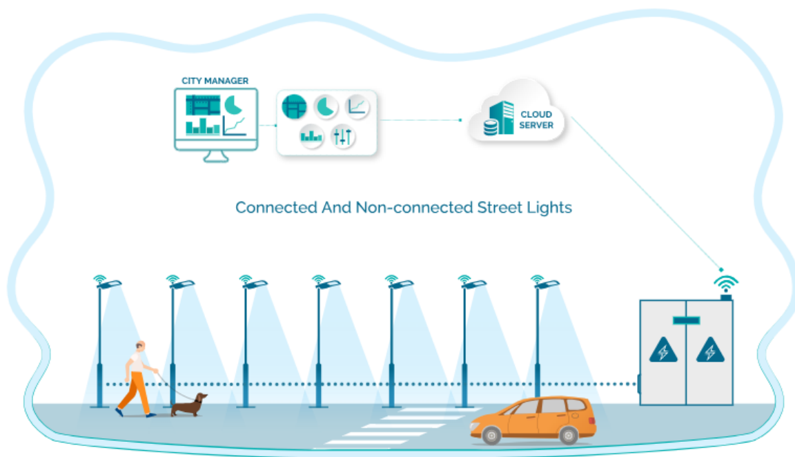
Slika 1. Slikoviti prikaz sustava vanjske rasvjete

Planovi predstavljaju podloge za projekte vanjske rasvjete i izradu Akcijskog plana. Bitno je razvoj rasvjete usmjeriti i uskladiti s zakonom o zaštiti od svjetlosnog onečišćenja. Najvažnije komponente vanjske rasvjete koje bitno utječu na provedbu zakona prikazani su na slici ispod.